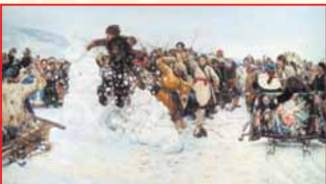
«Взятие снежного городка» В.И. Суриков, 1891

Из многочисленных правил и рекомендаций, которые следует соблюдать во время этого праздника, можно назвать основные. Во-первых, на масленицу уже нельзя есть мясную пищу. Мясоед (период, отделяющий зимний, Рождественский пост от весеннего, Великого) подходит к концу, и воскресенье накануне масленицы оказывается