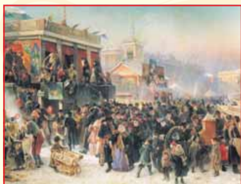
«Народное гулянье во время масленицы на Адмиралтейской площади в Петербурге». К.Е. Маковский, 1869

В масленицу звучало множество песен, прибауток, приговоров, большая часть которых не имела обрядового значения, это были веселые песенки, посвященные масленице и масленичному гулянию.